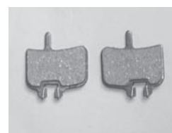
Hydrauliques et MX-1 plaquettes